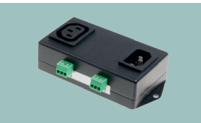
Detector de Corte Eléctrico Modelo y Control On/Off PowerEgg para equipos Hwgroup

Hasta 1Amp Conexión directa a Entradas digitales/Entradas de contacto seco Para equipos SUN-XX y HWg Poseidon