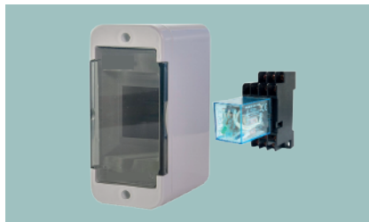
Relay de Potencia R-220

Tensión de Trabajo: 110/230V Interfaz de Detección: Salida a Digital Input de equipos Hwg. Control de salida: Puede controlar el encendi- do y apagado de consumos de hasta 8A Interfaz de control: Entrada Digital directa a la Salida de Relay de equipos Hwg.