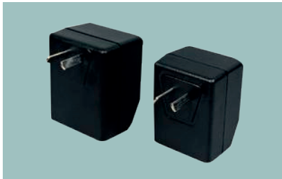
Detector de Corte Eléctrico Modelo EP-220

Alimentación: 10.5...14V DC . Tiempo de Start-up:60s Indicación de alarma: LED Rojo. Salida de Relay, Contacto del Relay: Hasta 1A/30V DC (0.5/125V AC) Área de protección: Máx 40m 2 Máx altura 7m Temperatura de Trabajo: 0°C a 70°C. Máx velocidad del aire: 600m/min. Estándar: EN54-7 Protección: IP 42 (EN60 529)