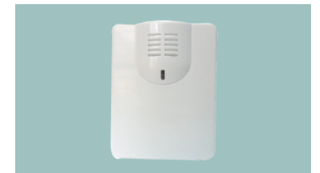
Detector de presencia de Agua/ Inundación Modelo EP-12

Para control de bombas de agua Sistemas Frío/Calor Arranque de extractores Compatible con todos los modelos SUN-XX y HWg Poseidon que posean salida de Relay