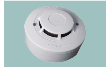
Detector de Humo Modelo: FDR-26

Alimentación: 10.5...14V DC . Tiempo de Start-up:60s Indicación de alarma: LED Rojo. Salida de Relay, Contacto del Relay: Hasta 1A/30V DC (0.5/125V AC) Área de protección: Máx 40m 2 Máx altura 7m Temperatura de Trabajo: 0°C a 70°C. Máx velocidad del aire: 600m/min. Estándar: EN54-7 Protección: IP 42 (EN60 529)