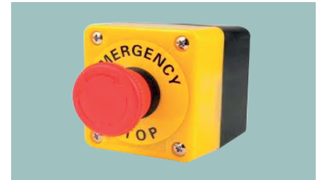
Botón de Pánico.

Sensor magnético c/cable para puertas. Medidas: 34mm x 13.5mm x 8mm Máxima Apertura 2,5cm Salida NA. Soporte Autoadhesivo/ Tornillos